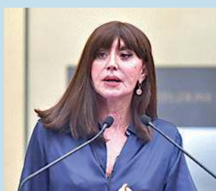
La ministra Anna Maria Bernini

Per reggere l'onda d'urto dei 64 mila candidati medici contro i 21 mila che lo scorso anno avevano superato il quiz di ammissione ai corsi, il ministero dell'Università ha stanziato 50 milioni di euro per sostenere per i primi sei mesi le università statali in cui sono presenti corsi di laurea magistrale a ciclo unico in medicina, odontoiatria e veterinaria. «Le risorse sono destinate a sostenere le attività e i servizi rivolti agli studenti, accompagnando la riforma del semestre aperto, che ha introdotto nuove modalità di accesso ai corsi di area medica con accesso libe-