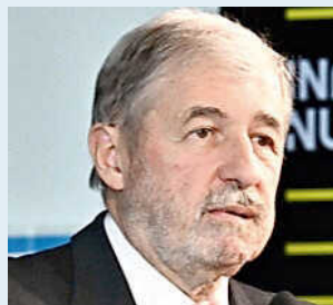
MARCO BUCCI PRESIDENTE REGIONE LIGURIA

Lo Stato spende poco per la sanità, ma dobbiamo essere bravi a gestire senza fare deficit