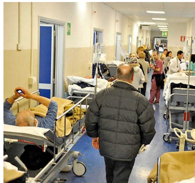
Il pronto soccorso dell'ospedale San Martino di Genova

Lo Stato spende poco per la sanità, ma dobbiamo essere bravi a gestire senza fare deficit