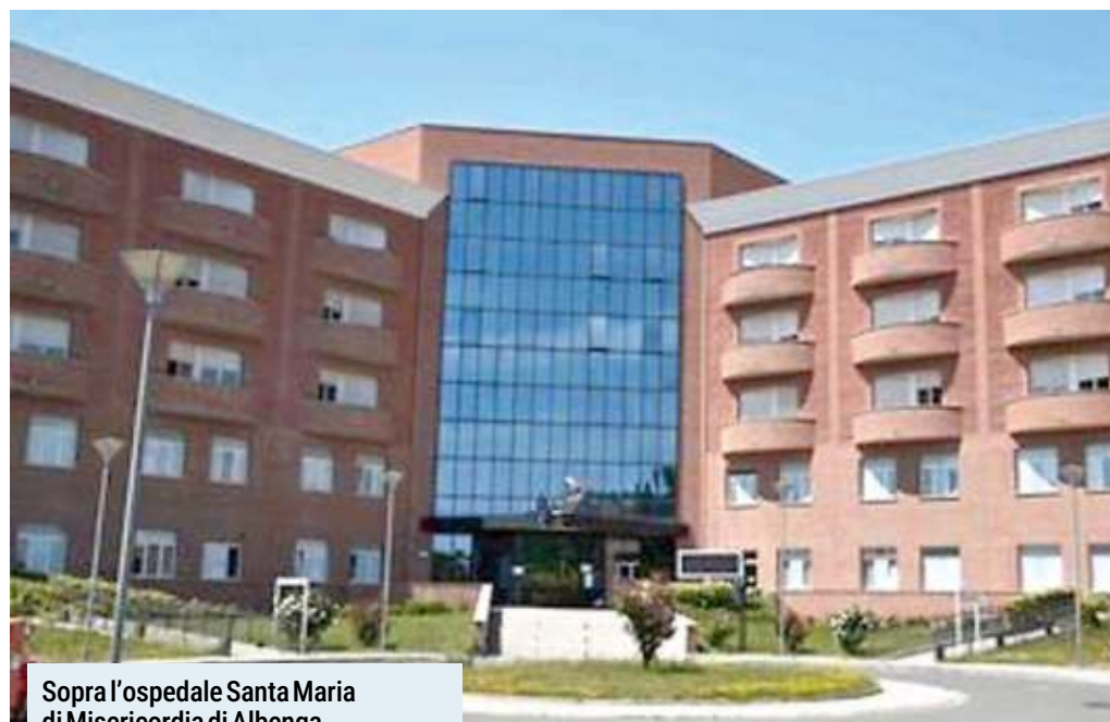
Sopra l'ospedale Santa Maria di Misericordia di Albenga Sotto l'Asl di via Collodi a Savona

In provincia la vaccinazione è offerta gratuitamente a Savona, nell'ambulatorio di via Collodi da lunedì a giovedì 8.30-12.30 e 13.30-16.30, venerdì 8.30-12.30, si può telefona-