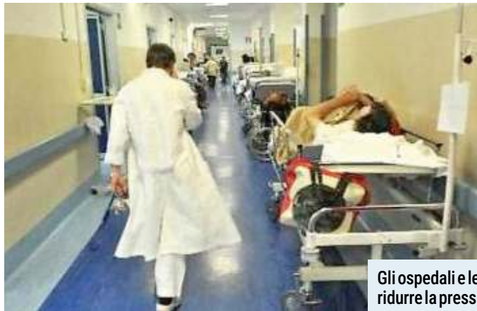
Gli ospedali e le case di comunità dovrebbero ridurre la pressione sui pronto soccorso

«A tre anni dall'avvio del Pnrr e a 16 mesi dalla scaden-