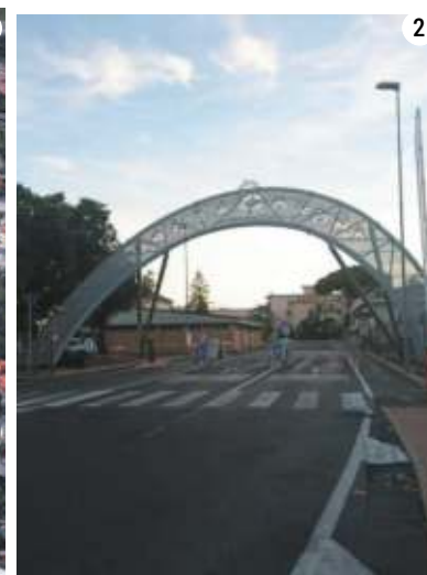
1. L'area che occuperà il nuovo ospedale Santa Corona 2. L'entrata attuale 3. L'ospedale com'è oggi 4 Una foto storica del padiglione Chirurgico

La nuova elisuperficie è prevista in copertura». I tempi? Circa 38 mesi di cantiere e un investimento da 247,6 milioni di euro per una soluzione che prevede anche un nuovo parcheggio su due livelli e 600 posti nello spazio dell'attuale Piastra servizi. Questa ipotesi (come tutte le altre) prevede la demolizione dell'edificio ex Polio, del Padiglione chi-