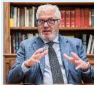
ANGELO GRATAROLA ASSESSORE SANITÀ REGIONE LIGURIA

Avremo ambulatori aperti dalle 8 alle 24. Serve una campagna per spiegare quando andare in pronto soccorso