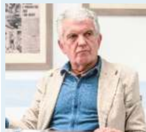
LUIGI BOTTARO DIRETTORE GENERALE ASL 3 GENOVA

Il 30% dei pazienti che arriva al pronto soccorso sono over 65 che il medico non riesce a gestire