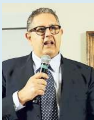
GIOVANNI TOTI PRESIDENTE REGIONE LIGURIA

Sull'applicazione il cittadino troverà anche tutti i documenti sanitari che lo riguardano