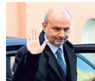
ORAZIO SCHILLACI MINISTRO DELLA SALUTE

Forbice tra spesa pubblica e privata I dati del Mef evidenziano l'aumento della spesa sanitaria privata