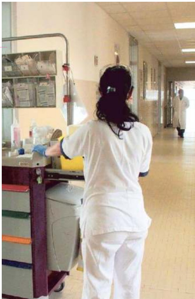
Gli organici di infermieri e Oss sono stati incrementati

so di bandire concorsi, avvisi, bandi. Lo sforzo dell'azienda si vede nel fatto che nel solo 2022 abbiamo attivato una trentina di procedure. Emerge ancora di più nel tasso di efficacia dei nostri concorsi che è del 50%. Vuol dire che riusciamo ad assumere la metà dei medici che si presentano e non è poco: quando si fa una graduatoria, bisogna considerare che il 50% dei medici poi non accetta, perché preferisce rimanere nell'area metropolitana o si tratta di specializzandi, che di fatto non si possono assumere fino al termine della formazione. Fino a 5 anni fa avevamo procedure con 15-20 medici internisti, ormai questo dato è un sogno». Sono stati nominati 8 direttori di struttura e sono in corso le procedure per altri 9 primari. Più roseo il quadro del comparto. «Il 2022 si è chiuso con 392 assunzioni, di cui 250 infermieri e 142 Oss – continua Boccia -. Gli organici passano da 3.660 unità totali del 2020 ai 3.756 del 2022: in sostanza il saldo degli infermieri è stabile, ma possiamo contare su un centinaio di Oss in più, da 475 a 569». —