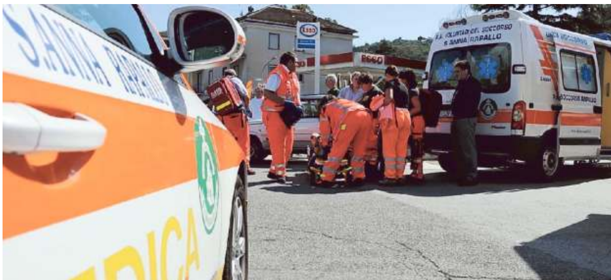
Un'esercitazione con militi e Guardia medica