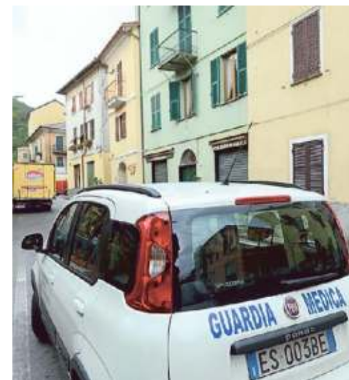
Un'auto del servizio medico a Montebruno

gli interventi della guardia medica, solo nell'Asl3, nei primi 7 mesi del 2022