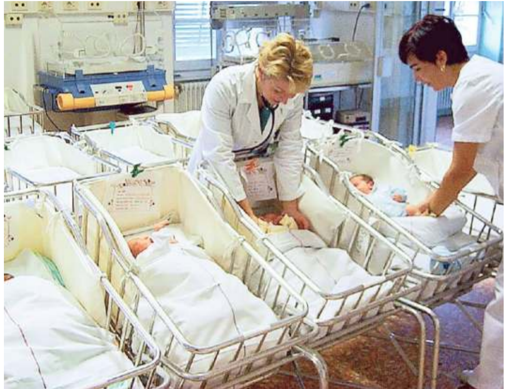
Centro nascite al San Paolo di Savona

2018: 1266 (di cui 697 a Savona e 569 a Pietra) 2019: 1129 (di cui 627 al San Paolo e 502 al Pietra) Punto nascite unico al San Paolo 2020: 1179 parti in ospedale 2021: 976 parti in ospedale (altri 6 bambini sono nati in casa o nel tragitto verso il San Paolo) L'EGO - HUB