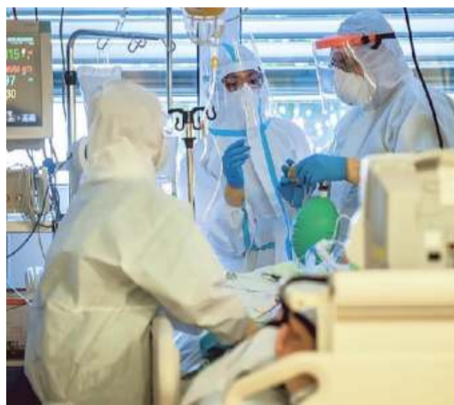
Personale medico e infermieristico in servizio nell'era Covid

«Dover fare i conti con 62 dipendenti sospesi, di cui 53 infermieri e oss e 9 amministrativi, è come ipotizzare che tre reparti fossero totalmente scoperti dal personale. Chiaramente non è così, perché abbiamo messo in atto misure correttive, ma la situazione è complessa», interviene il direttore generale dell'Asl, Marco Damonte Prioli, tracciando un paragone per dare il senso di quanto il mancato adempimento della legge pesi sugli organi-