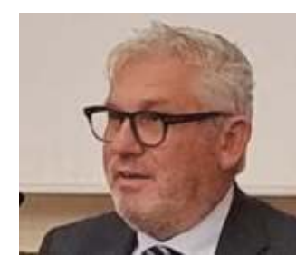
ANGELO GRATAROLA ASSESSORE REGIONALE ALLA SANITÀ

«In linea teorica e solo su base geografica la prima stesura indica nell'ospedale Evangelico di Voltri la struttura deputata alla copertura dell'estremo ponente cittadino, ma sono al vaglio altri elementi per definirne l'assetto finale - dice l'assessore regionale - Un analogo ragionamento vale per l'area di Ponente tra le province di Imperia e Savona per la quale, in una logica di area vasta, stiamo valutando la strategia possibile per mantenere tre punti nascita, due dei quali nel territorio della Asl 2 e uno a Sanremo».