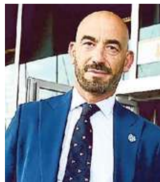
MATTEO BASSETTI DIRETTORE MALATTIE INFETTIVE DELL'OSPEDALE SAN MARTINO

«Sono mesi che lo dico: se la regola resta che un positivo, anche asintomatico, resta a casa dai 7 ai 10 giorni rischiamo che l'Italia si blocchi. E poi si introduce un meccanismo per il quale ci sono positivi di serie A e positivi di serie B».