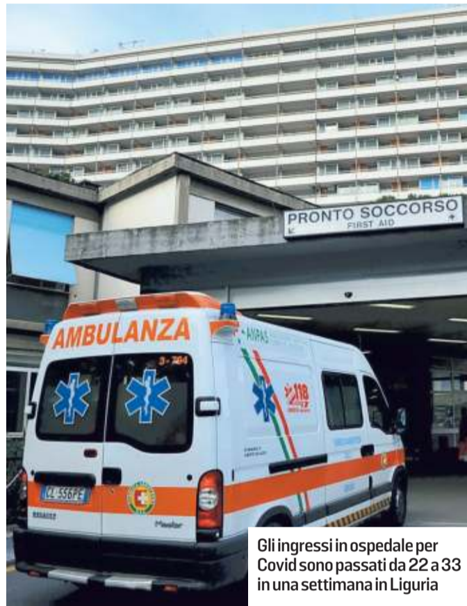
Gli ingressi in ospedale per Covid sono passati da 22 a 33 in una settimana in Liguria

glia con 3. Ci sono stati tre decessi: un novantenne e due donne di 82 e 91 anni. I nuovi positivi sono 1.637, 20,4% dei 7990 tamponi effettuati, un tasso in discesa