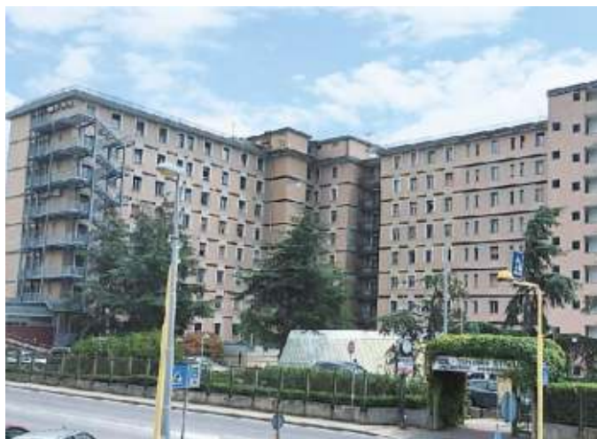
L'ospedale San Paolo di Savona dove è avvenuta la tragedia

Sarà l'autopsia a chiarire la causa della morte del neonato, che lunedì mattina è venuto al mondo in condizioni già molto critiche all'ospedale San Paolo di Savona. Il piccolo si è spento poche ore dopo la nascita, nonostante i ripetuti tentativi dell'équipe medica di rianimarlo e tenerlo ancorato alla vita. La salma del piccolo ora verrà trasferita all'Istituto di medicina legale di Genova, che si occupa-