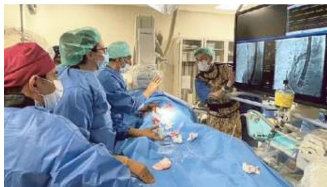
Medici e infermieri di Cardiologia interventistica di Pietra al lavoro

to. «I sintomi e i disturbi di un'insufficienza tricuspide clinicamente rilevante comprendono affaticamento generale, dispnea, astenia, edemi periferici, disfunzione epatica, spesso trascurati e/o non tenuti in degna considerazione in quanto presenti in pazienti di età avanzata - spiega Shahram Moshiri, direttore della S.C. di Cardiologia-Utic Ponente - Tra le va-