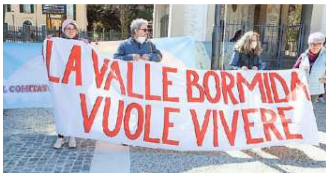
La manifestazione pro ospedale a Cairo