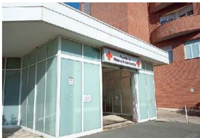
L'ingresso del punto di primo intervento di Albenga

Il destino del punto di primo intervento ingauno sembra compattare centrodestra e centrosinistra