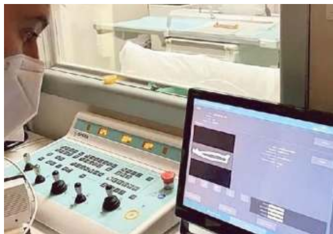
Un laboratorio della Casa della Salute

L'Asl corre per recuperare il tempo perduto Convenzione con la Casa della Salute