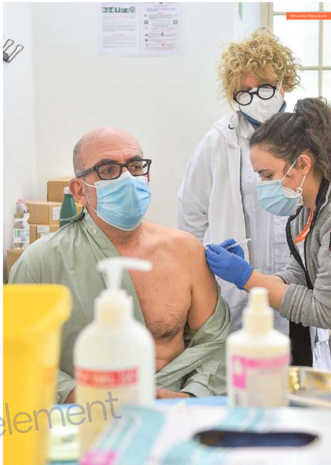
Il centro di vaccinazione all'Albergo dei Poveri di Genova

Se una persona che ha prenotato la somministrazione del vaccino non si presenta all'appuntamento stabilito dovrà effettuare una nuova prenotazione. Nel caso in cui l'appuntamento salti per cause che non dipendono dal diretto interessato, come ad esempio nel recente blocco di AstraZeneca avvenuto la scorsa settimana, sono le Asl a iniziare a richiamare le persone il cui appuntamento era saltato. In questo specifico caso l'impegno è di ricontattare tutti (circa 11mila persone) entro la fine della prossima settimana per fissare un nuovo appuntamento.