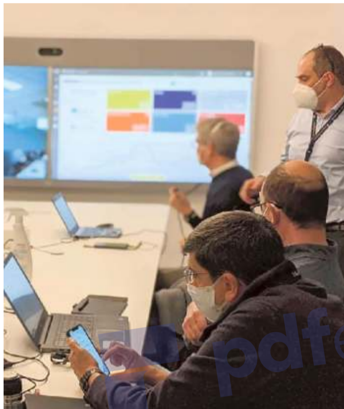
Il centro di prenotazioni online di Liguria Digitale

A questo punto le dosi di vaccino devono essere prese in carico e stoccate. Ad occuparsene sono le farmacie aziendali e ospedaliere, in ciascuna delle quali è stato designato un referente che si raccorda con il responsabile delle politiche del farmaco