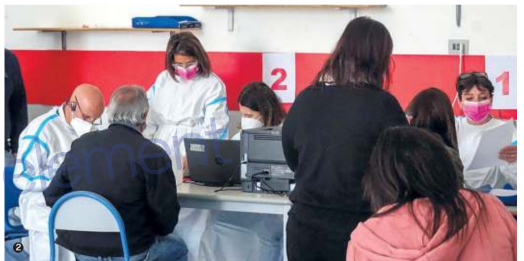
1. Quattro medici di famiglia ieri mattina sono riusciti a iniettare 70 dosi prima della sospensione. 2. Le pratiche con gli addetti dell'Asl che hanno compilato moduli e formulari dei «vaccinandi»