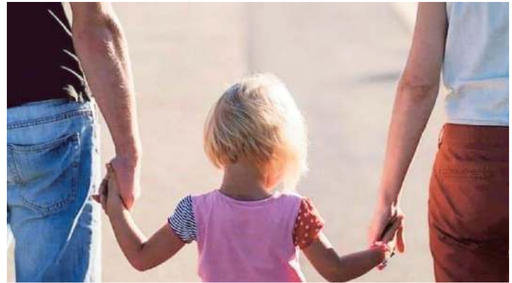
La pandemia ha ingigantito i problemi psicologici e non solo per le giovani generazioni