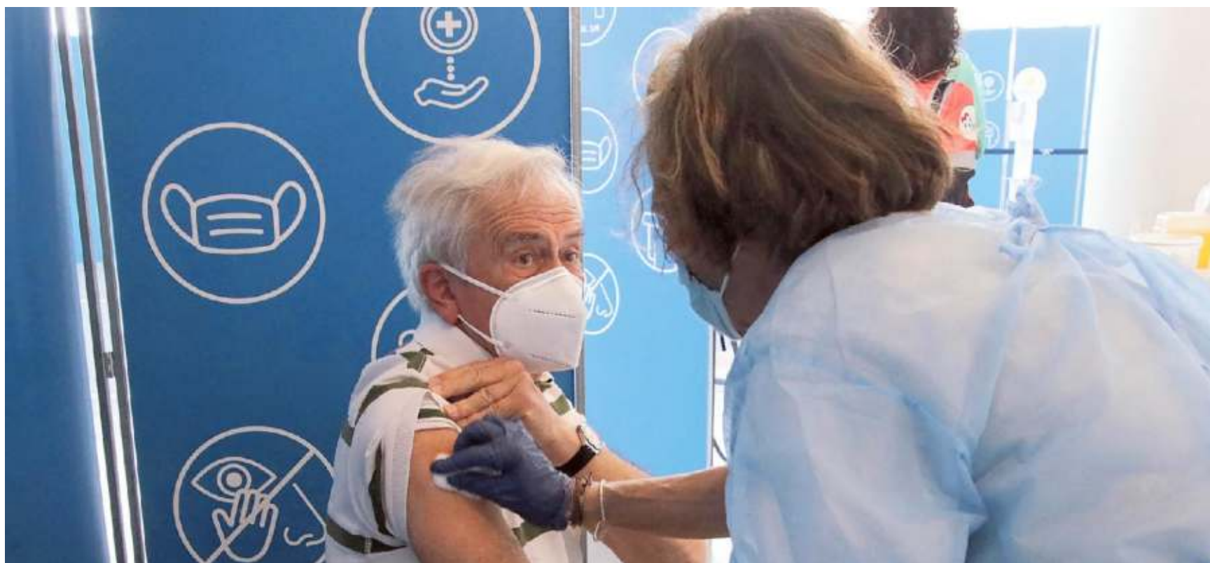
La vaccinazione agli over 80 al Palacrociere di Savona