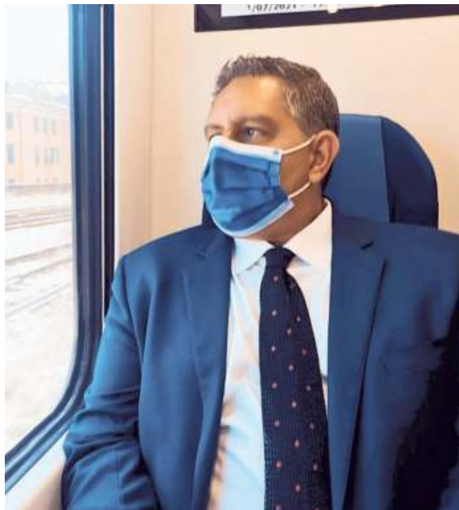
Toti, ieri ad Albenga e Ventimiglia, ha preferito viaggiare in treno

Per prenotare serve la tessera sanitaria, la certificazione della prima dose e la dichiarazione della permanenza nella regione per scopi turistici per almeno 14 giorni. Inserendo questi dati si ottiene l'elenco delle sedi disponibili e la data in cui effettuare la vaccinazione. Il sistema genera il promemoria che si può salvare o stampare. Arrivato ad Albenga per l'inaugurazione del rio Fasceo il governatore ha parlato anche del futuro del Santa Maria di Misericordia: «Contiamo di riaprire il Punto di primo intervento a breve». —