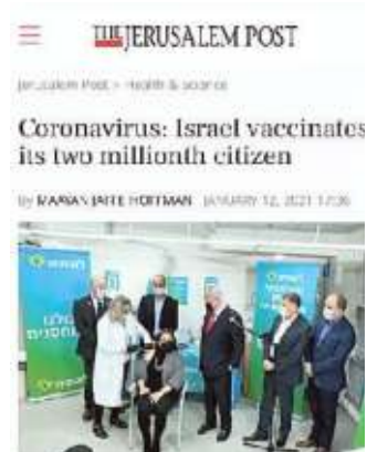
La pagina del Jerusalem Post in cui si parla dell'efficienza del modello israeliano