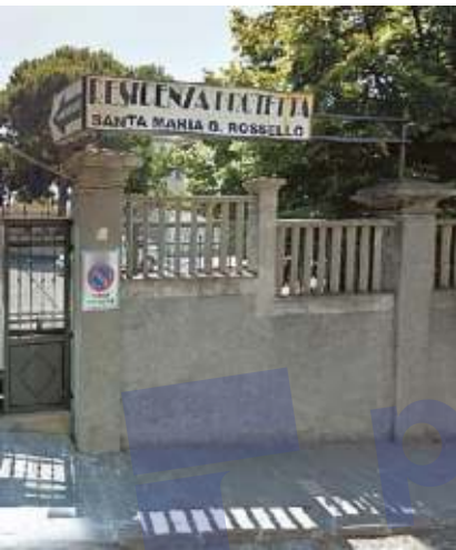
lo in via De Mari

ve restare alta. Forse abbiamo abbassato anche un po' la guardia, non si può e non si deve. A breve cominceranno le