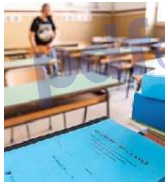
La sanificazione a scuola

da Maria Giuseppa Rossello si ritrova a combattere il virus. Ieri i 60 ospiti e i 30 operatori della struttura sono stati sottoposti al tampone, ma, a rendere singolare la situazione è il fatto che il contagio è sorto dopo che gran parte degli anziani e dei dipendenti erano già stati vaccinati (prima somministrazione) dall'Asl. Per capire quanto il focolaio sia esteso bisognerà attendere i risultati dei test, di fatto rischiano di