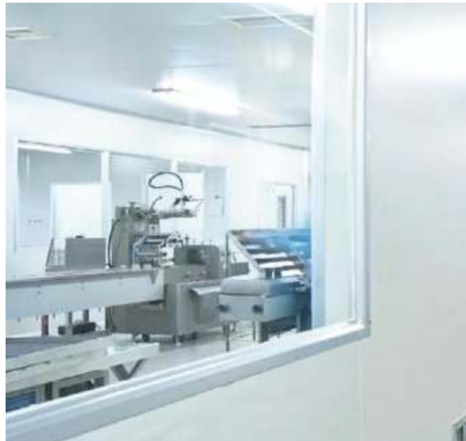
Un'immagine dell'azienda tratta dal sito web della Sunrise

casello autostradale di Vispa. D'ora in poi la campagna vaccinale dovrà procedere per classi di età, di conseguenza Regione e Asl stanno cercando realtà attrezzate per la conservazione dei vaccini "freeze" Pfizer e Moderna, visto che al momento questi due sono i sieri che possono essere somministrati agli under 60. La Sunrise gode di una licenza ministeriale per stoccare i farmaci, tanto che nel capannone adiacente