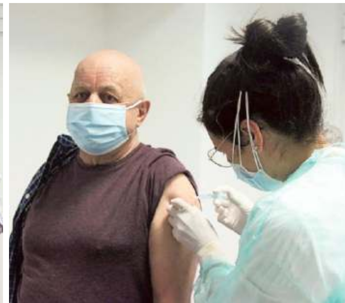
Due medici vaccinano alla farmacia Rodino-Vieri di Cairo