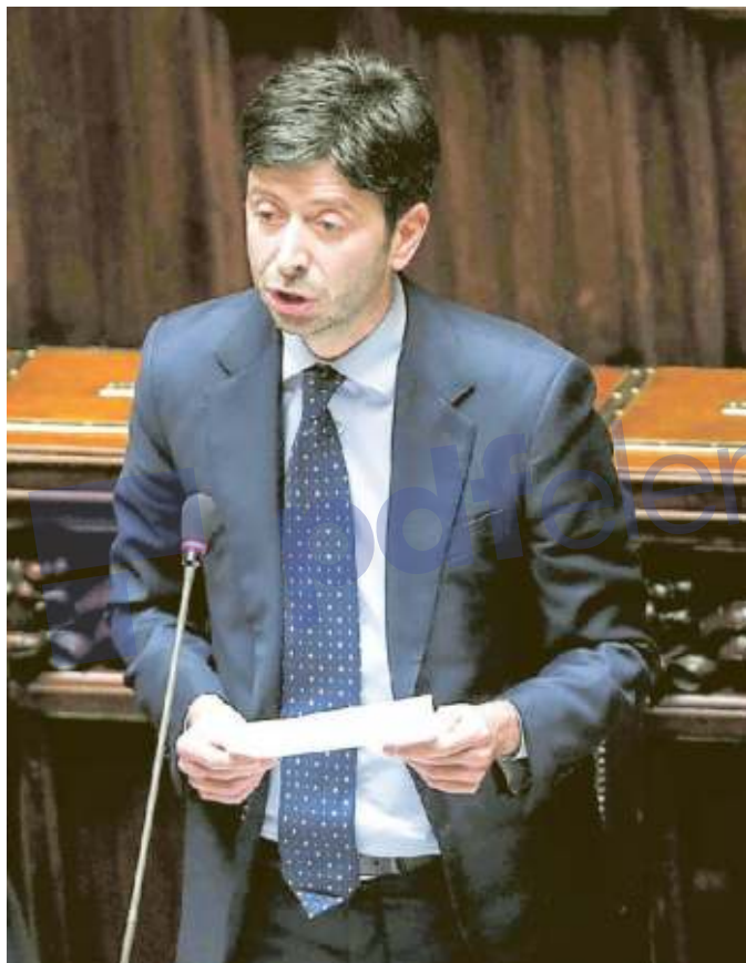
ROBERTO SPERANZA MINISTRO DELLA SALUTE ESPOSANTE DI LEU

Tra i nove candidati in fase avanzata di sperimentazione nessuno aveva ancora richiesto all'Ema la cosiddetta «rolling review». Che altro poi non sarebbe se non la procedura velocizzata che consente ai super tecnici dell'Agenzia di valutare i dati della sperimentazione prima ancora che questa abbia termine per velocizzare al massimo i tempi di approvazione. Solitamente, spiegano da Amsterdam, sede