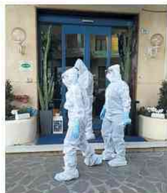
I sanitari davanti all'hotel Bel Sit

Sono arrivati nel cuore della notte a Castiglione d'Adda e nei paesini limitrofi gli ultimi 35 ospiti del Bel Sit e Al Mare coinvolti nell'emergenza coronavirus di Alassio. I riflettori però restano accesi sulla ventina di dipendenti dei due alberghi di via Boselli che sono ancora in quarantena. Due di loro hanno già manifestato l'intenzio-