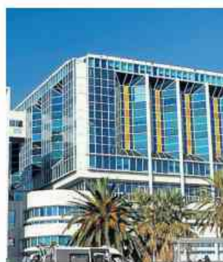
L'ospedale Lenval di Nizza

Costa Azzurra: il Covid-19 è stato rilevato anche su una bambina di tre anni, ricoverata all'ospedale Lenval di Nizza. Ieri mattina è stato il sindaco Christian Estrosi a comunicarlo, nel corso di un incontro di lavoro con professionisti della salute, organizzato nel municipio sul coronavirus.