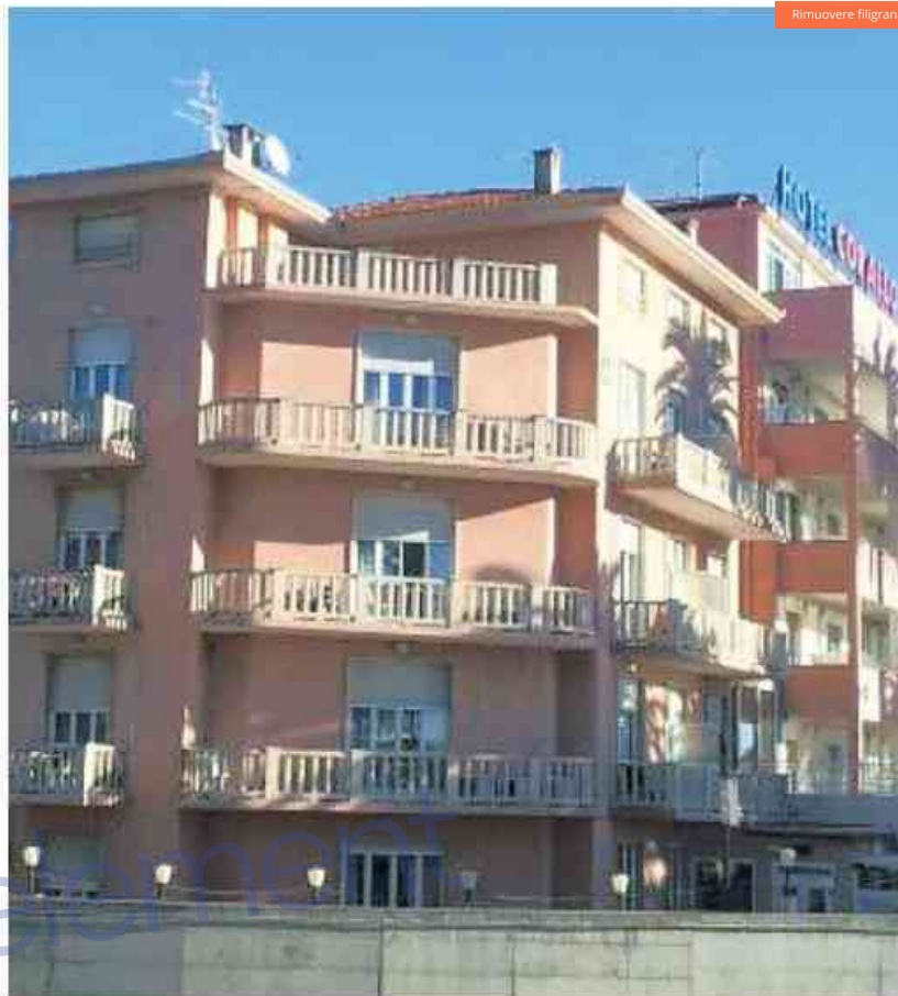
La portacontainer Cala Pula: un marittimo è stato sottoposto a tampone. A destra l'Hotel Corallo di Finalpia in cui alloggiava l'ultimo caso positivo riscontrato ieri