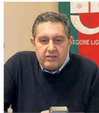
GIOVANNI TOTI GOVERNATORE LIGURIA

Prevista intorno alle 13 una ricognizione con il provveditorato e i responsabili de-