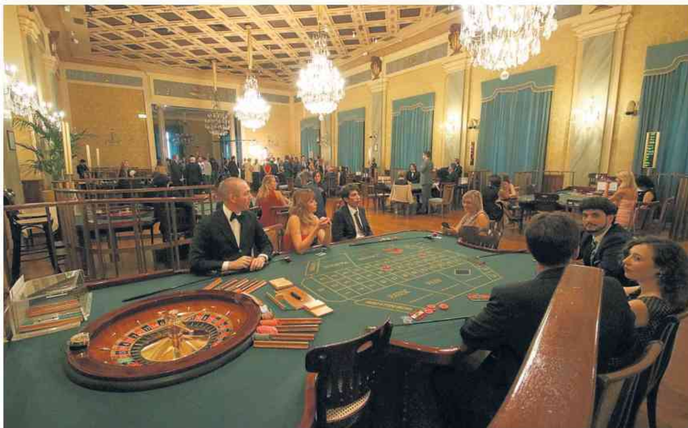
Una delle sale del casinò di Sanremo