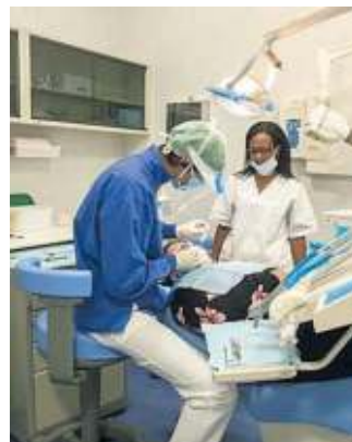
Chiesto indennizzo per i medici