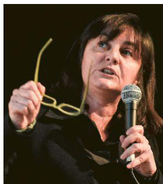
SONIA VIALE ASSESSORE REGIONALE ALLA SANITÀ

Ora la Regione è pronta ad avviare una campagna a tappeto per raddoppiare la copertura: tra la fine di gennaio e l'inizio di febbraio le cinque Asl liguri invieranno oltre 79 mila lettere ai genitori dei ragazzi dagli 11 ai 17 anni, ossia i nati negli anni che vanno dal 2003 al 2009. Poche righe per pro-