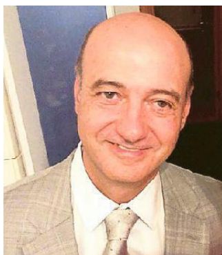
GIANCARLO ICARDI DIRETTORE DI SCIENZE DELLA SALUTE UNIVERSITÀ DI GENOVA

porre la vaccinazione gratuita e dare tutte le indicazioni: i primi appuntamenti negli ambulatori pubblici potrebbero venire fissati già nei primi i giorni di febbraio, ma sarà ogni Asl a de-